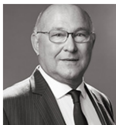
Michel SAPIN Avocat, Ancien Ministre