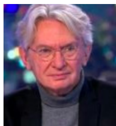
Jean-Claude MAILLY Ancien Secrétaire général de Force Ouvrière