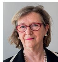
Catherine CHAMBON Sous-directrice de la lutte contre la cybercriminalité au Ministère de l'intérieur