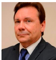
Charles BATTISTA Président de la FIGEC